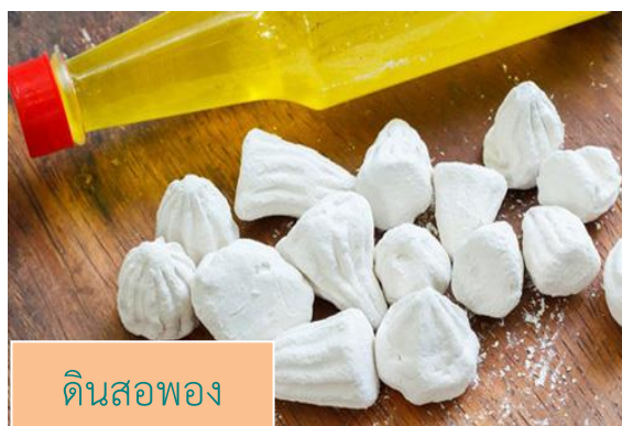
ดินสอพอง

“ดินสอพอง” ภูมิปัญญาไทยที่ได้จากดิน คนไทยโบราณนิยมนำเอา “ดินสอพอง” มาผสมกับน้ำหอมแล้วหยอดเป็นเม็ดเล็กๆ เก็บไว้ เมื่อต้องการใช้ก็จะนำมาละลายน้ำ แล้วใช้ทาตามเนื้อตามตัว ถือเป็นประเพณีที่ช่วยคลายร้อน และยังมีการใช้ดินสอพองติดตัวตลอดทั้งวันอีกด้วย คนไทยในยุคนี้คงคุ้นหน้าคุ้นตากับดินสอพองมากที่สุด เพราะในช่วงสงกรานต์ของทุกปีจะขาดเจ้าสิ่งนี้ไปไม่ได้ ซึ่งนอกจากจะนำมาปะหน้าทาตัวกันในช่วงสงกรานต์แล้ว